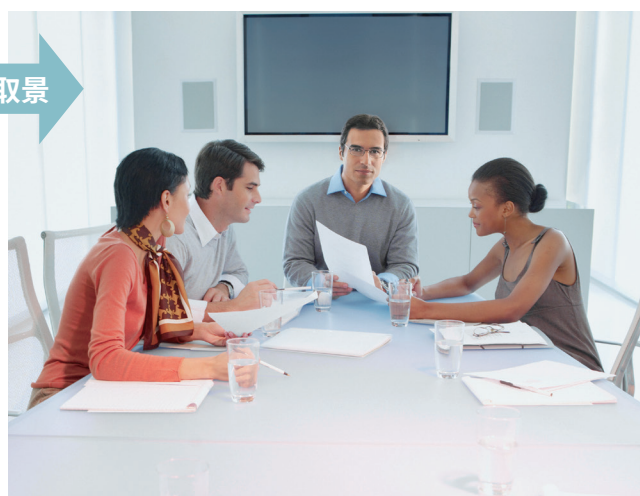
选取最佳取景范围